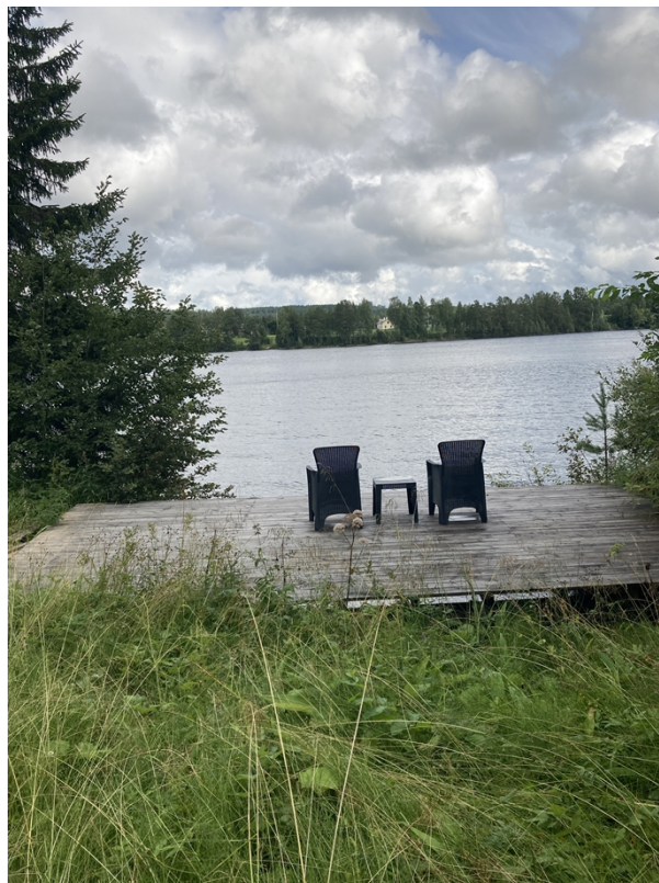
Figur 2, Befintligt trädäck.