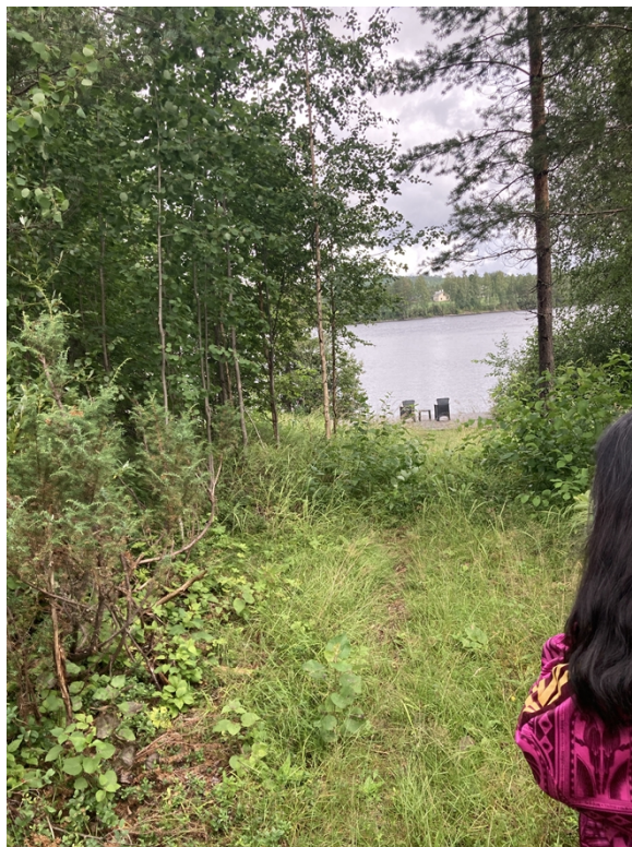
Figur 4, Befintlig väg ner mot trädäck.