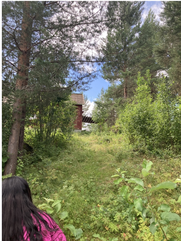
Figur 3, Befintlig väg ner från garage vid bostadshus.